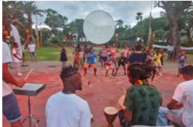
Rouler Killer au Maxiron maloya-2024